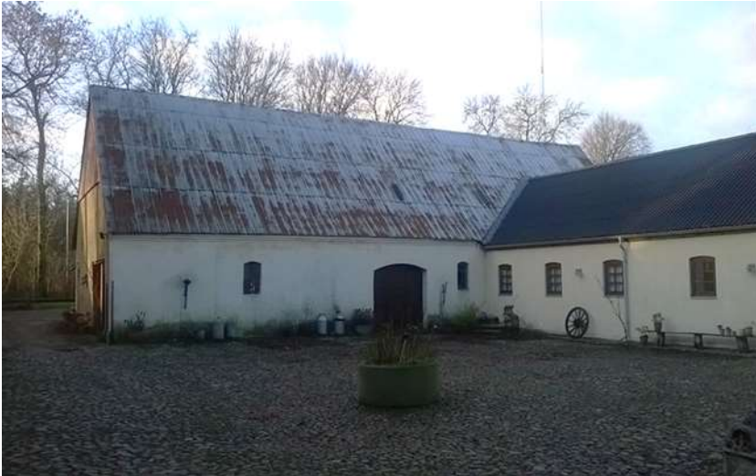
De gamle pigsten på gårdspladsen er bevaret. Foto Jonna Bach 2017

Da Inge og Kristian Haugland købte Gyngkærgård blev en del af jorden solgt til Per Worre, Toftegården. De gamle avlsbygninger og stuehuset blev nænsomt renoveret og en af længerne blev indrettet til en moderne virksomhed med import og salg af eksklusivt dametøj.