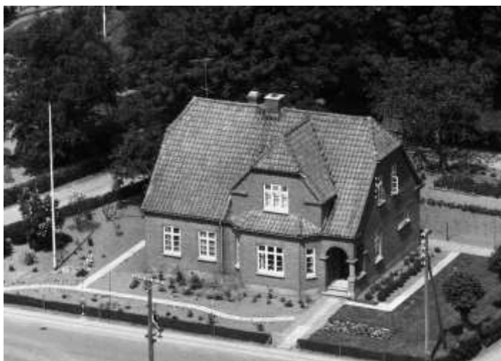
Ane og Christian Hverrehus` smukke aftægtsbolig, Tinggade 21, Løvel.