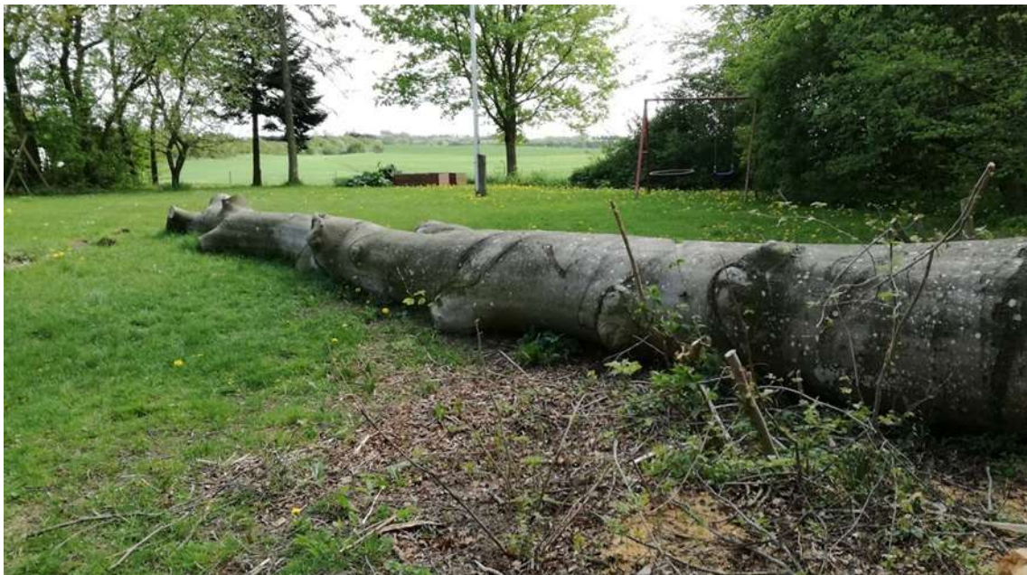
Det gamle træ måtte lade livet til fordel for udsigten fra Rørbækgård ud mod Søndermarken og de nye byggegrunde.