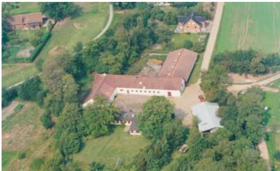
Den fjerde længe med vognporten er fjernet og der blev opført ny svinestald i 1973.