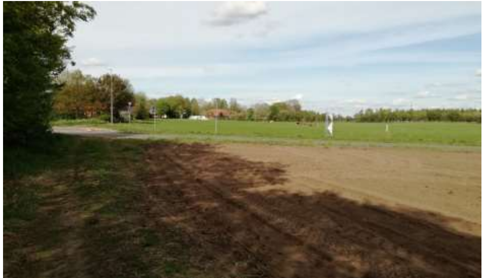
Et kig fra den gamle vej ind mod Rørbækgård og Søndergård