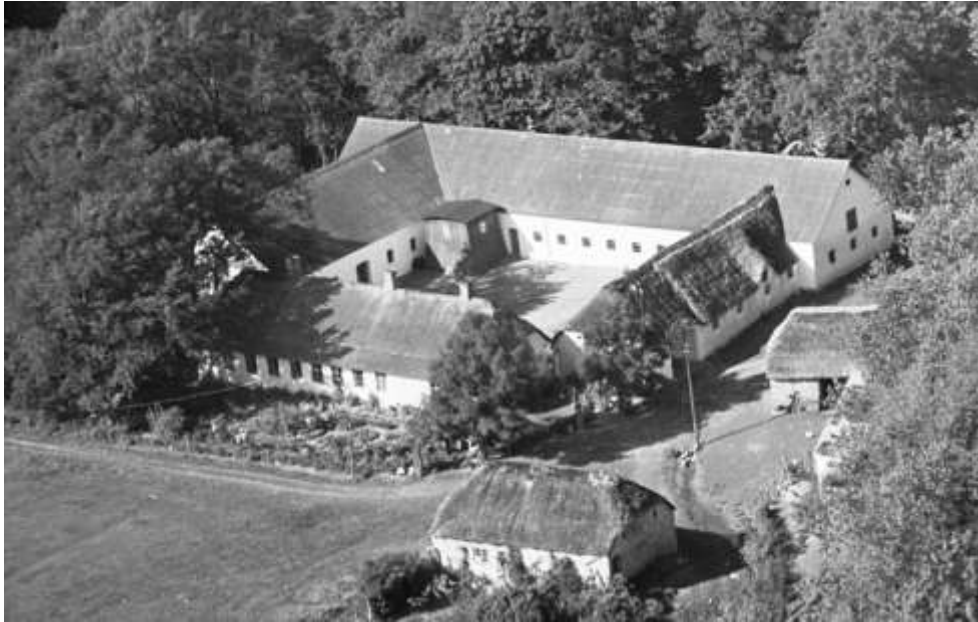
Rørbækgård, ca 1950. Luftfoto, Det Kgl Bibliotek.

Rørbækgård er en af Løvels ældste gårde.