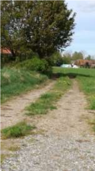
Vejen set fra Gl. Røddingvej