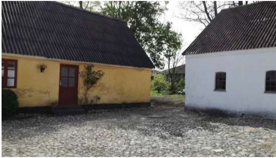
Den gamle gårdplads med pigsten er bevaret. Foto: Jonna Bach 2019