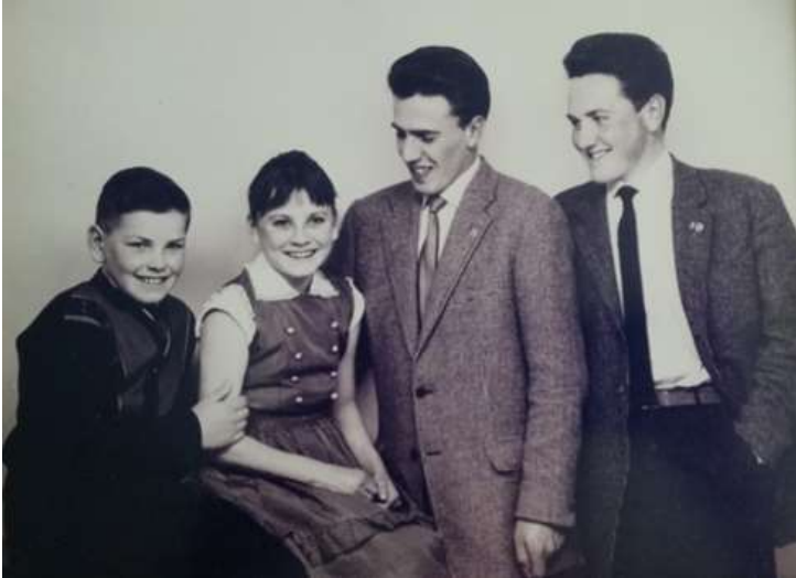
Børnene fra Rørbækgård ca 1955.