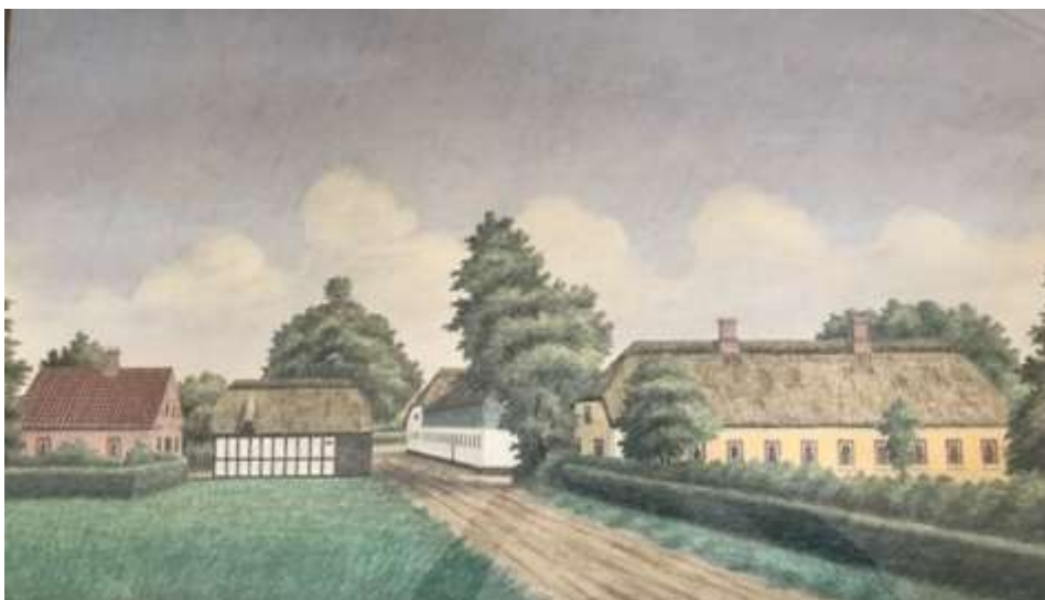
Gårdmaleri af Rokhøjgård. Til venstre ses aftægtshuset. Bindingsværkhuset er fårestalde