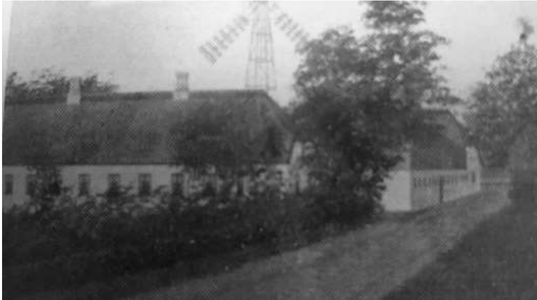
Det nye stuehus i 1848 med ny vindmølle

I 1848 bygger de et nyt stuehus og delvis nye udbygninger. Det bestod til 1970.