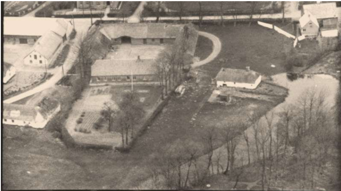
Foto: Danmark set fra luften