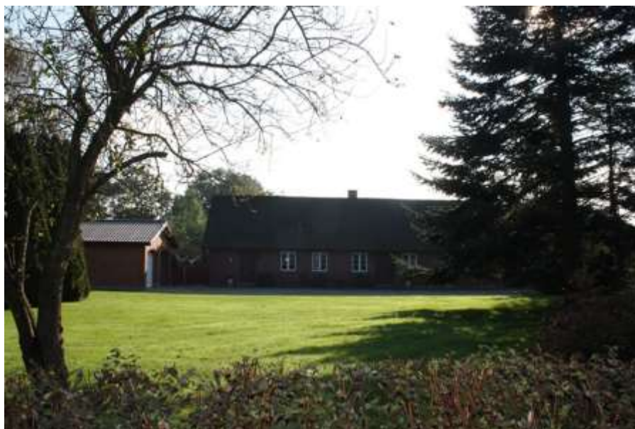
Gåsekærgård, som det så ud i 2015, set fra Tinggade.

Resten af jorden blev solgt fra og stuehuset renoveret.