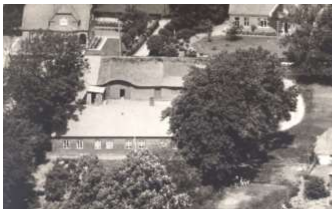
Den gamle gård blev bygget midt i 1800 tallet