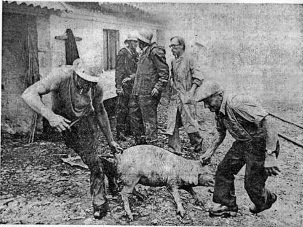
Naboer og lokale brandfolk hjalp til med at få de skræmte svin væk fra de brændende bygninger. Ca. 70 grise var i dem. Kun 25 blev reddet.