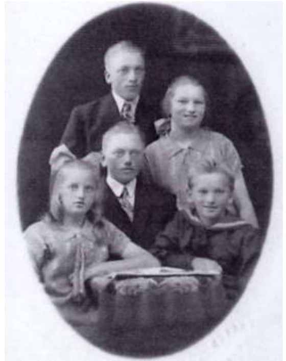
Børnene på Næstegård ca 1930