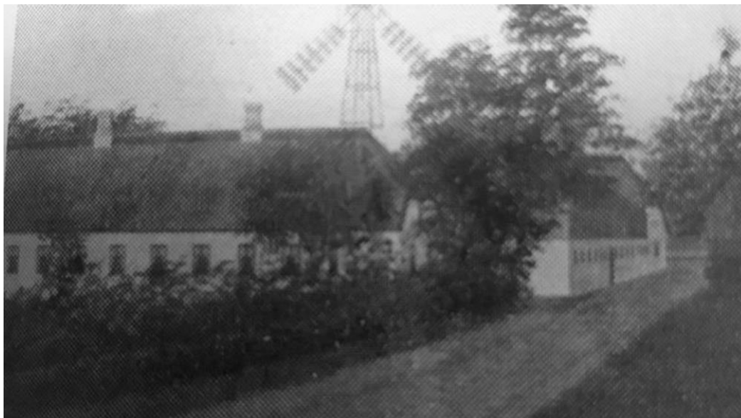
Det nye stuehus i 1848 med ny vindmølle

I 1848 bygger de et nyt stuehus og delvis nye udbygninger. Det bestod til 1970.