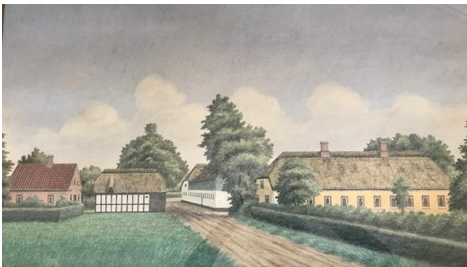
Gårdmaleri af Rokhøjgård. Til venstre ses aftægtshuset. Bindingsværkhuset er fårestalde