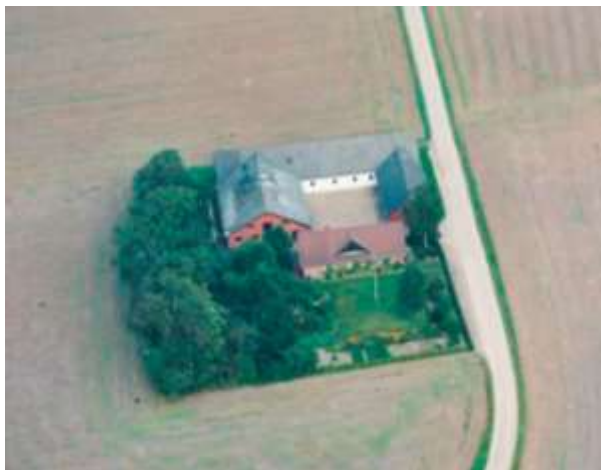
Stabligård 1990