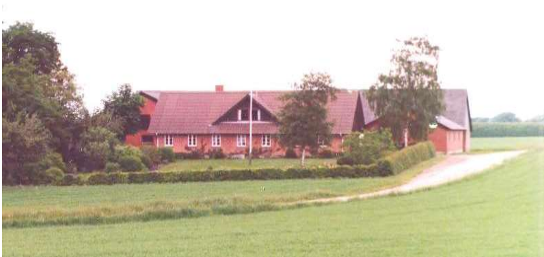
Stabligård 1988.