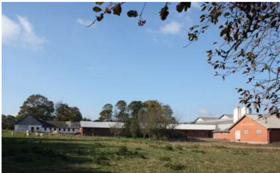
Toftegården 2010