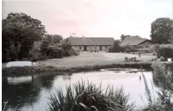
Løvel Østergård set fra søsiden år 2000.