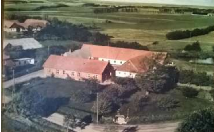
Østergård, ca 1960