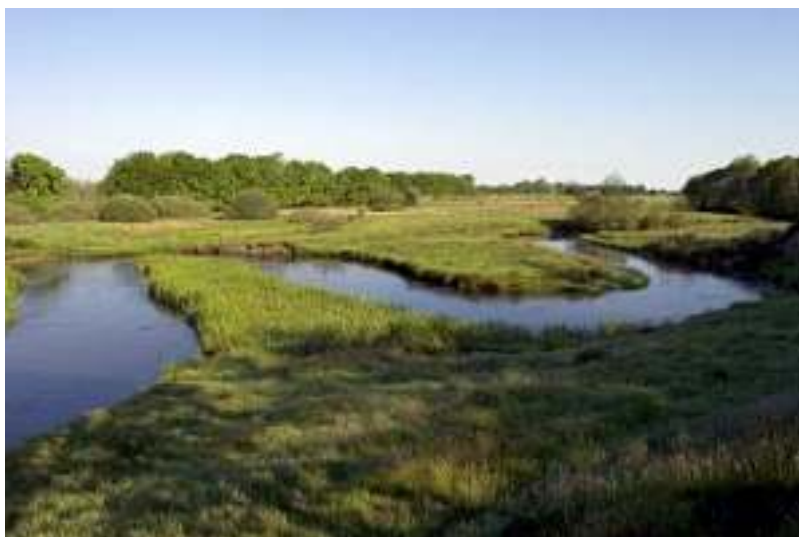
Den utæmmede å

Efter at åen var reguleret, var der kun de dybe søer tilbage og de er der endnu. Jeg vil her nævne: Rødsø, Øris sø, Klejtrup sø, Tjele Langsø og Ingstrup sø.