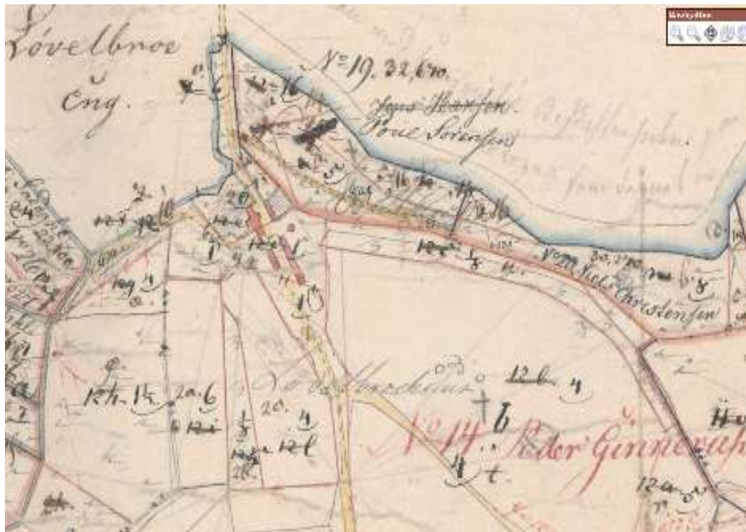
Matrikelkort 1815 - 1864