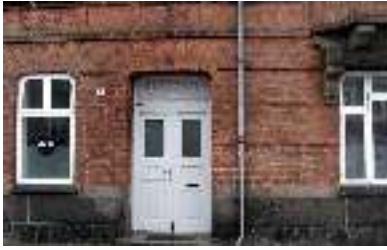
Jernbanegade 12, Viborg