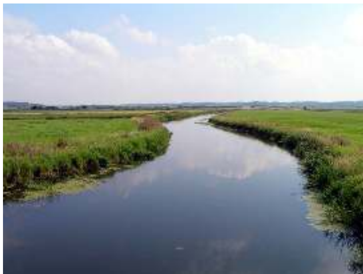
Den tæmmede å, som den kom til at se ud efter 1900