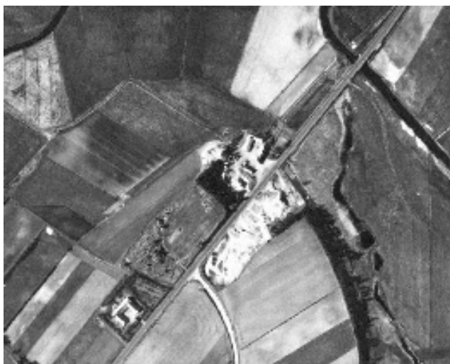
Lufffoto 1954. Grusgrav øst for A13

Det kan tillige nævnes, at der ogsaa har været Smedie her til 1946, dog var den lejet ud. Normal Besætning bestaar af 12—14 Kreaturer, 2 Heste, 2 Søer Opdræt samt Fjerkræ, ca. 150 Høns. Paa Marken findes et ret stort Grusleje, hvor Viborg Amt udvinder Vejmateriale.