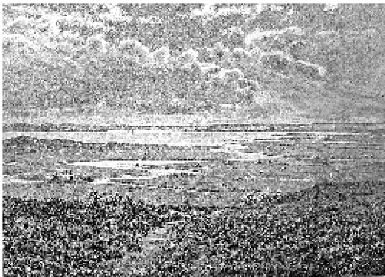
Hjarbæk Fjord i slutningen af 1800-tallet. Tegnet af A. Thorenfeld