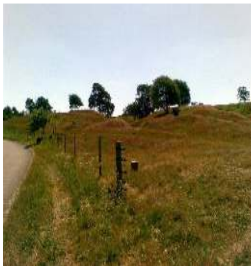
Normannshede – hærvejens spor

I mange år var der et vadested lidt vest for den nuværende Løvel Bro, og hjulsporene ved Normannshede viser tydeligt, hvordan man har flyttet vejen, når hjulsporene blev for dybe.