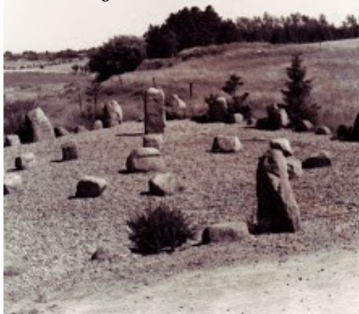
Bystævnet i Batum