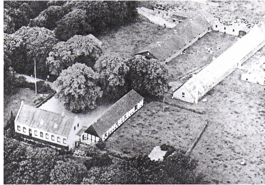
Sødal Hovedgaard 1990