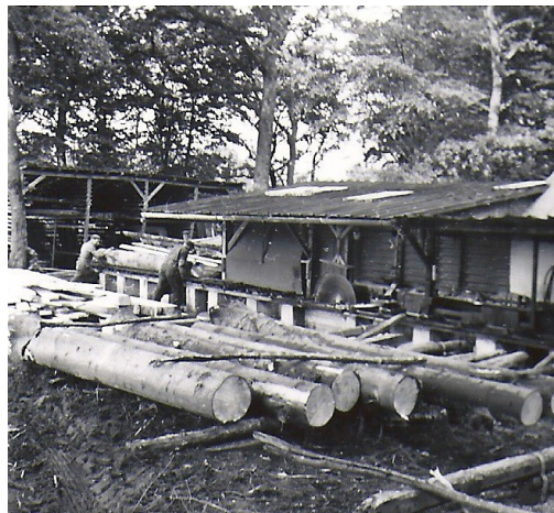
Savværket i Sødal Skov, mens der blev produceret "Sødal Huse" i 1960-erne.