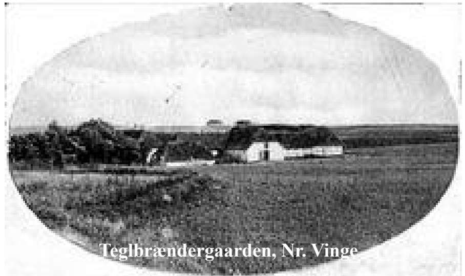
Teglblændergården, Nr. Vinge