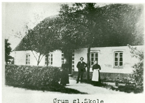
Ørum gl. Skole

I 1855 blev det nødvendigt at opføre en ny skole- og degnebolig. Det var den lange hvide bygning, som lå på hjørnet af Østergade og Vingevej. Bygningen var indrettet med en skolestue mod vest og degnebolig mod øst. Den gamle skole fra 1742 blev i mange år anvendt til udhus, men man havde dog forinden frasolgt det 4½ fags udhus fra 1814.