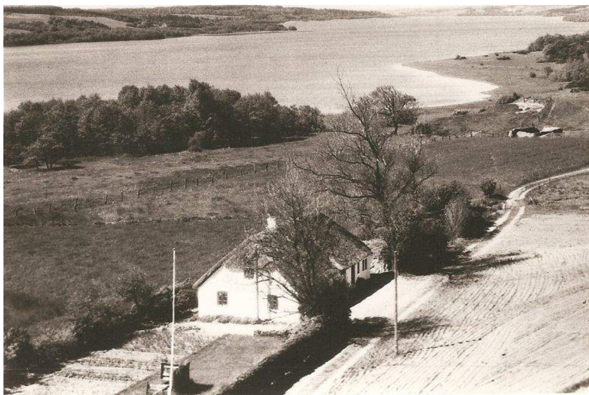
Rester af Bigum "skvatmølle" i baggrunden - 1959